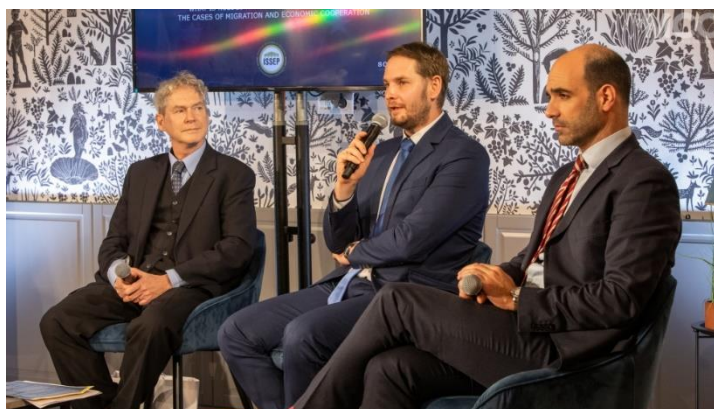
MCC-ISSEP konferencia, február 7.