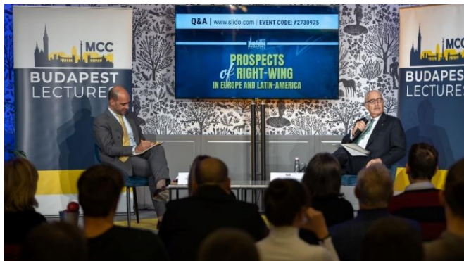
Budapest Lectures Andrés Pastrana Arangoval, október 13