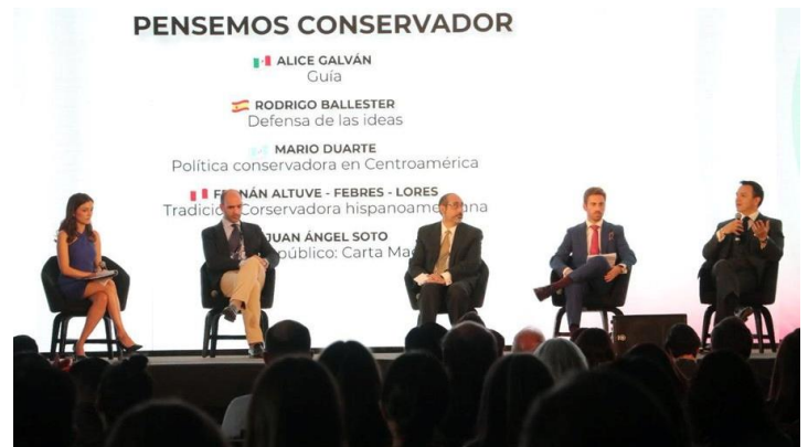
CPAC Mexikó, Defensa de las Ideas, november 19.