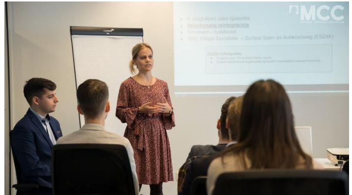
Előadás az Európai Unió történetéről Brüsszelben

A Műhely szervezte az Őszi Akadémia szakmai programját is, amely az iskola által évente szervezett kötelező rendezvény. A hétvégét Győrben tartották, ahol a diákok az orosz-ukrán háború következményeit vizsgálták, a világ különböző régióit és országait vizsgálva. A program zárásaként egy szimulációs játékban vettek részt, ahol egy lehetséges béketárgyalási folyamat részesei lehettek. A játékot szintén Műhelyünk két tagja szervezte, vezette és fejlesztette.