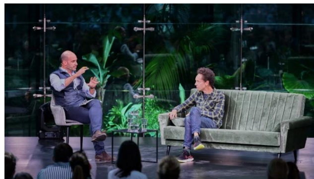
Brain Bar Malcolm Gladwell-lel, szeptember 30.