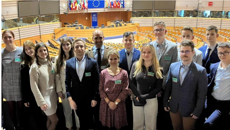
Látogatás az Európai Parlamentbe, október 26-án

2022. október végén a Műhely 12 diákból álló küldöttséggel tanulmányutat szervezett Brüsszelbe , ahol az Európai Bizottság és az Európai Tanács uniós tisztviselőivel, valamint az Európai Parlament tagjaival találkoztak.