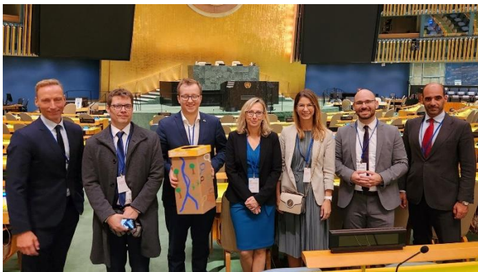
Challenges of Green transition, ENSZ székház, október 4.